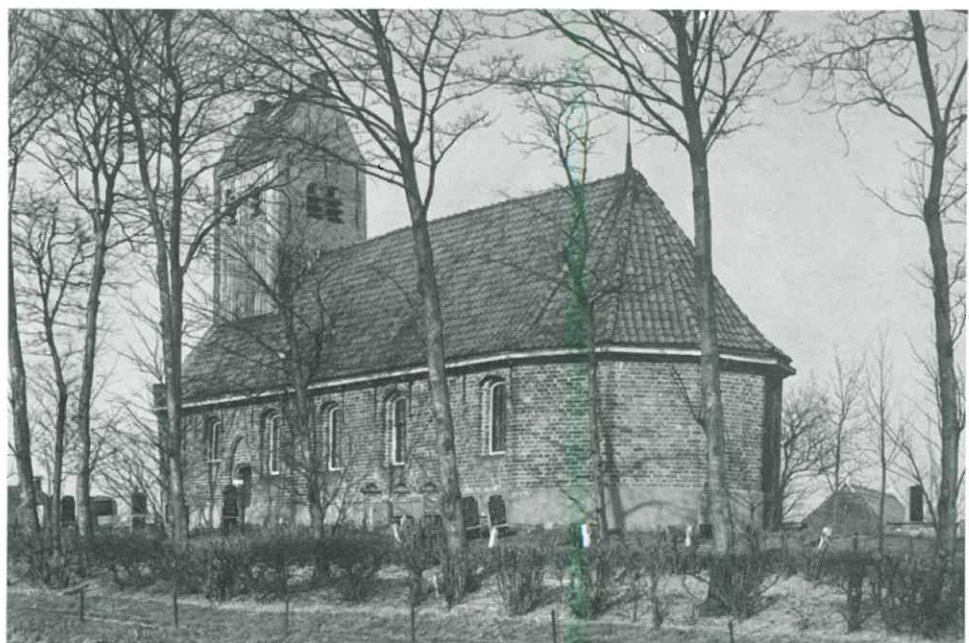
De kerk van Lichtaard van het zuidoosten.