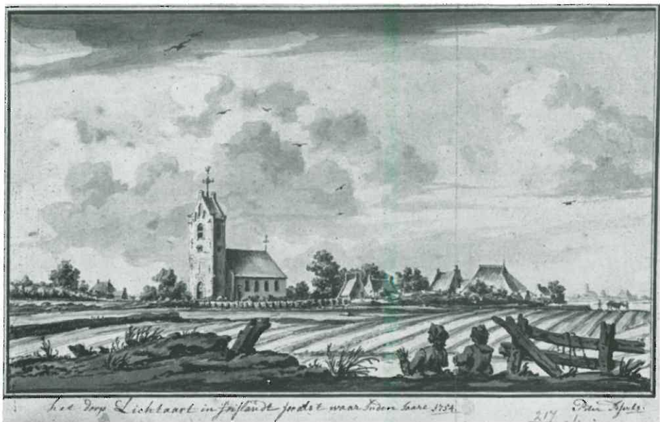
Gezicht op de kerk van Lichtaard door Piter Idserts, 1754. Fries Museum Leeuwarden.