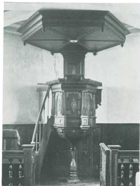
De 17de-eeuwse preekstoel in de kerk van Lichteard.

bol geprofileerde; aan de koorsluiting zijn zij alle gepeerkraald. De laatste zuilen opnieuw toegepast zijn.