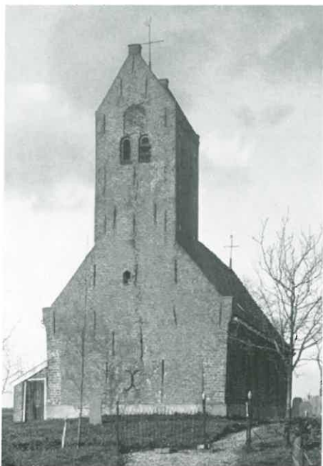
De kerk van Lichteard van het westen.